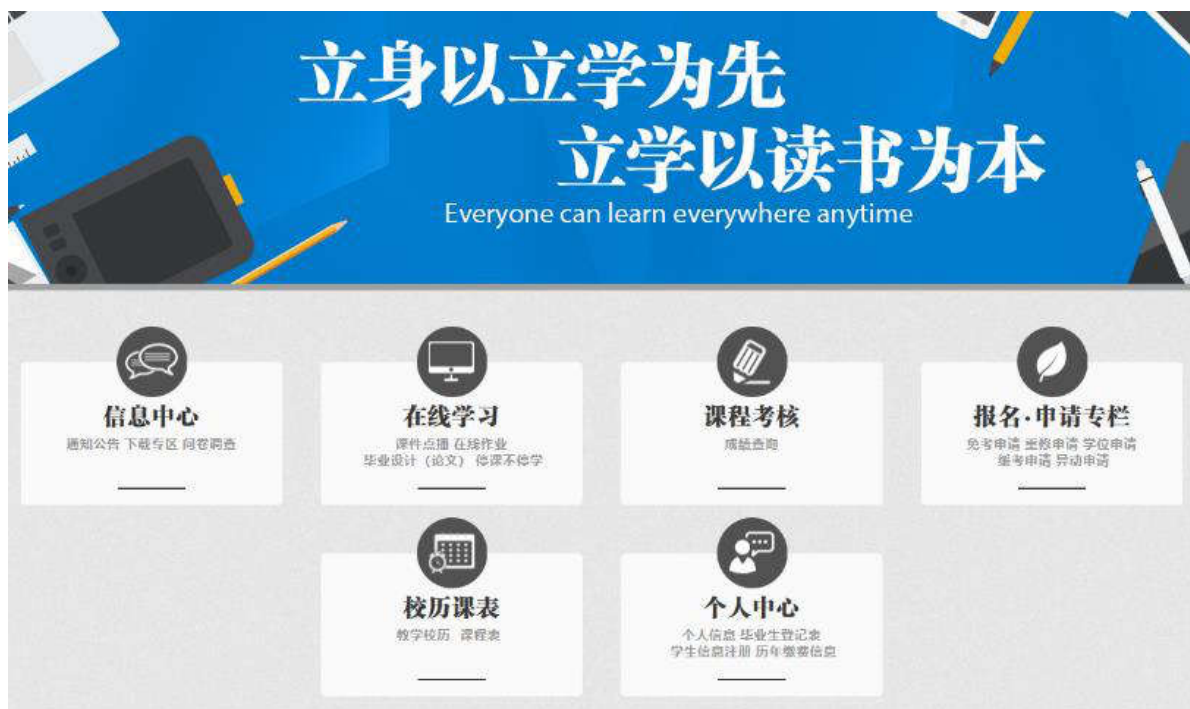
新教务系统的学生功能界面